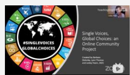
#WorldTeachersDay 教师在线共同体项目案例