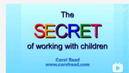
小学英语教学中的“秘密”