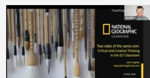
英语课堂中的独立性和创造性思维培养